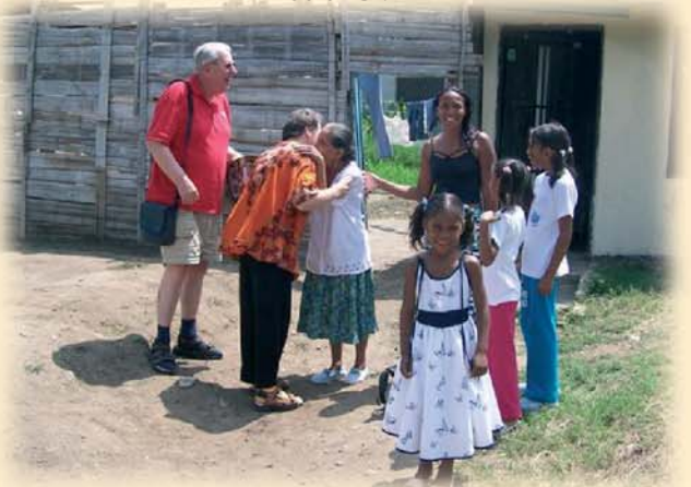
Op bezoek bij de familie Erazo in Benedicta